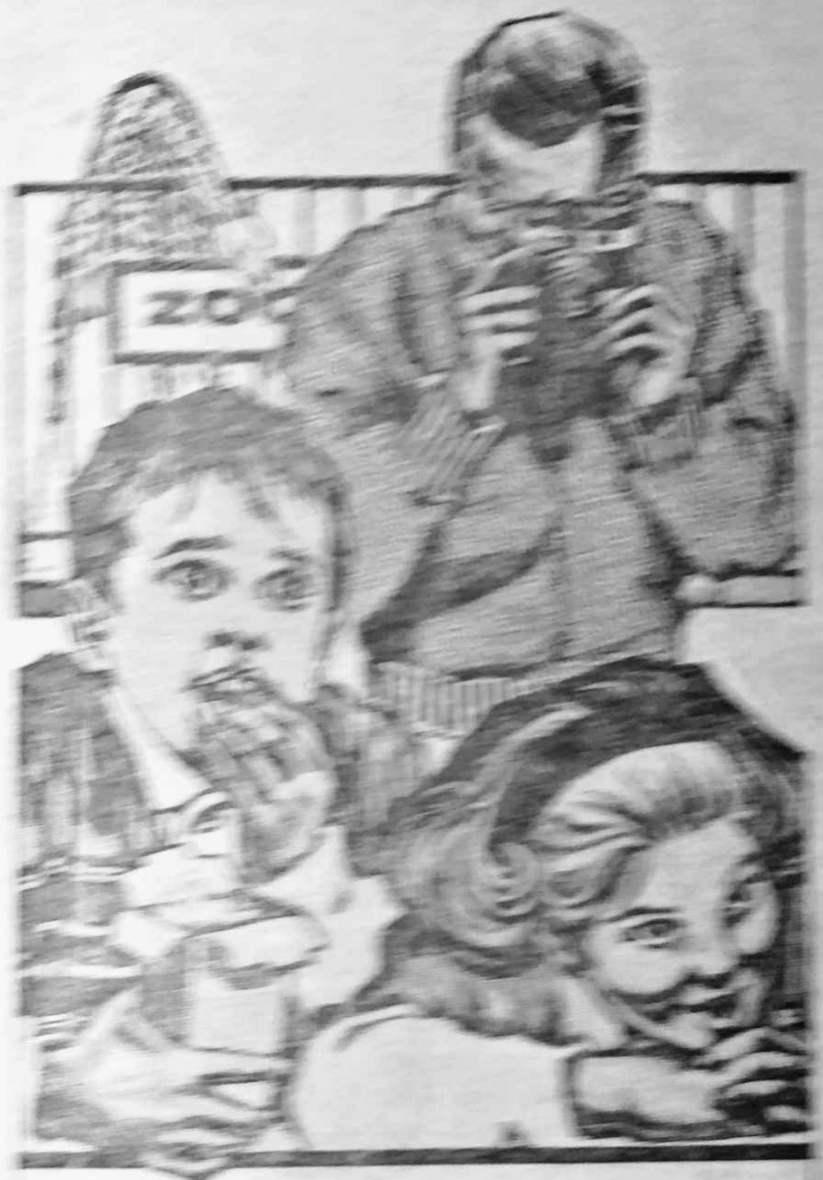
Student taking a picture of George Washington and the other students in the classroom.